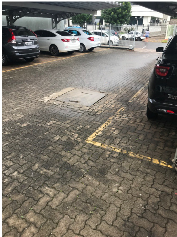
Figura 6 - Reservatório de incêndio enterrado