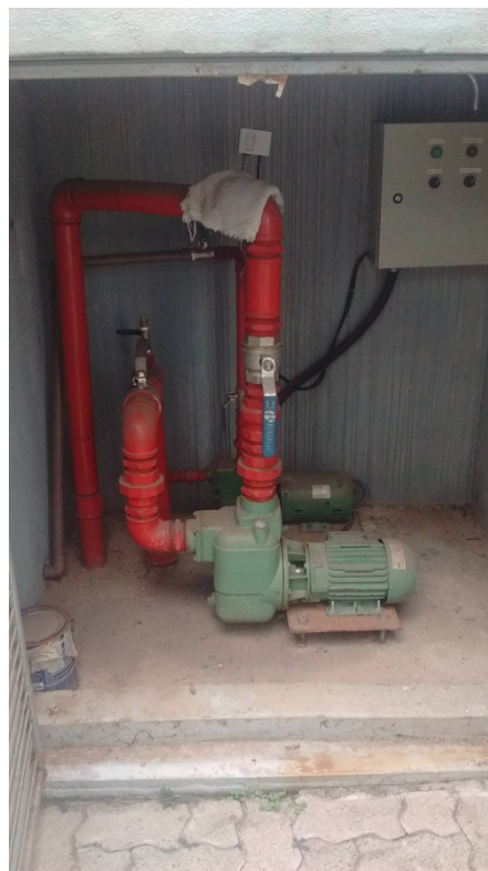
Figura 2 - Bomba principal e bomba Jockey