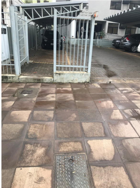
Figura 5 - Hidrante externo