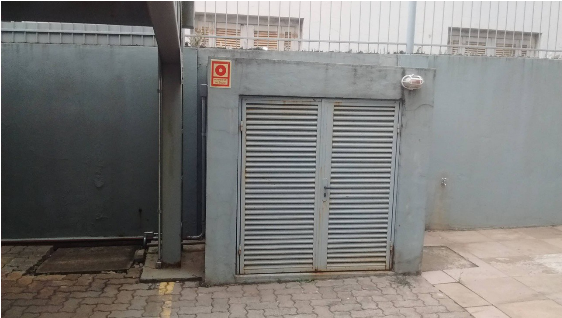
Figura 1 - Casa de bombas do sistema de hidrantes