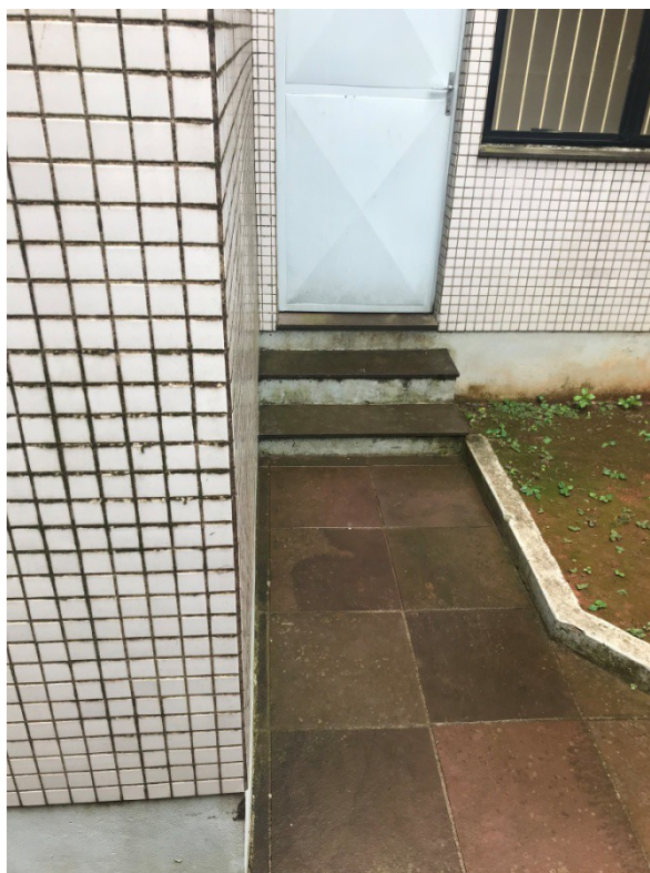
Figura 3 - Local de entrada do hidrante do térreo